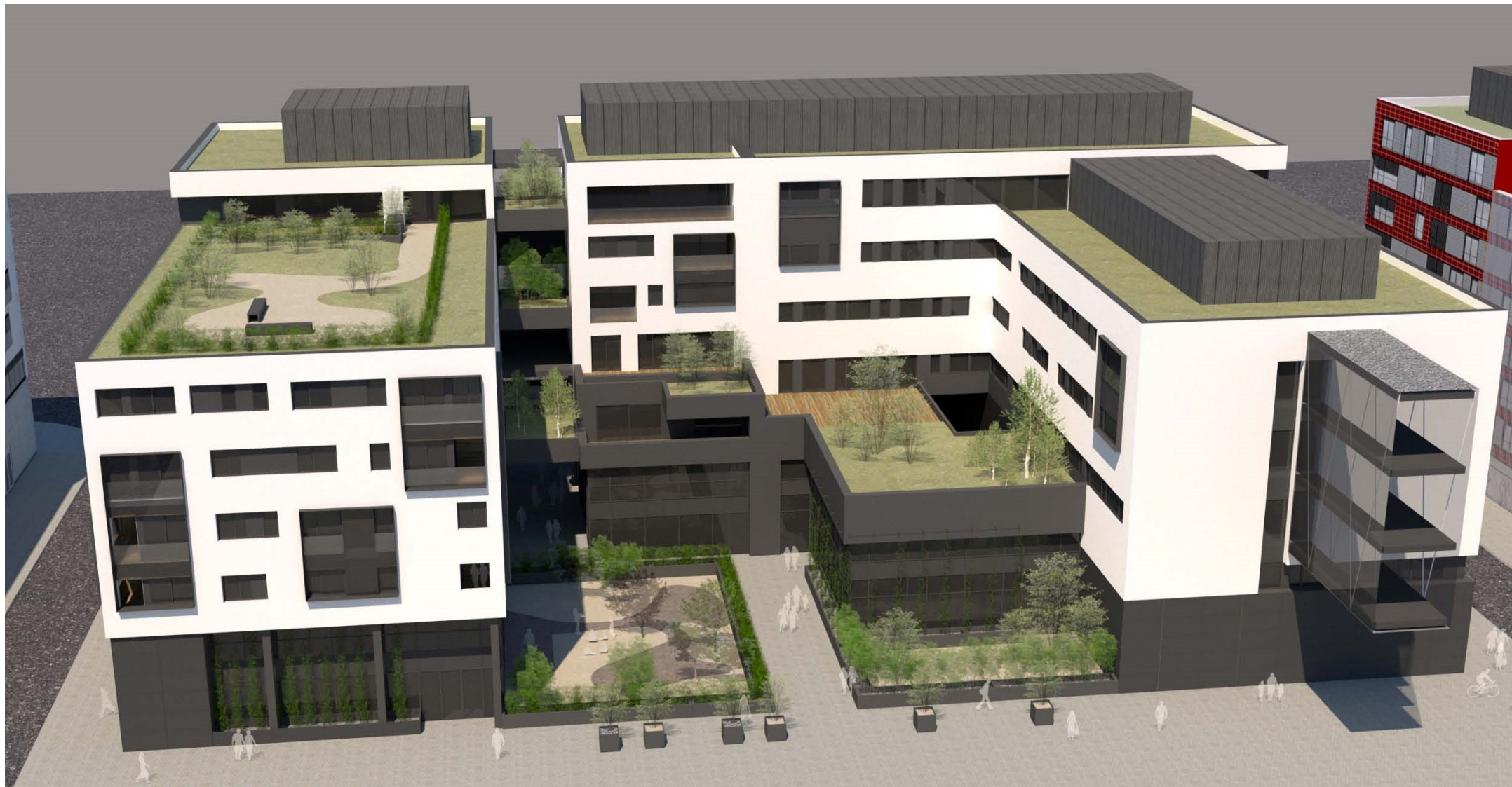
RESIDENCE THE GATEWAY