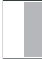
1/2 PAGE VERTICALE 90 x 250 mm 1/2 PAGE HORIZONTALE 185 x 122,5 mm