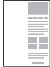
ANNONCE PROJET CONSTRUCTION 1, 3 ou 5 photos du projet + Description + Caractéristiques + Logo & contact agence